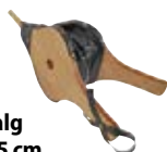
Blasbalg 40 × 15 cm 64307