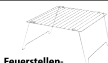
Feuerstellen- Grill 28 × 28 cm 81273