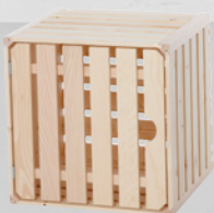
6 Wohnharasse mit Tür A 1/2 35 × 35 × 32 cm Art.-Nr. 74708