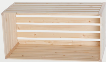
1 Wohnharasse A 1/1 35 × 70 × 32 cm Art.-Nr. 74710