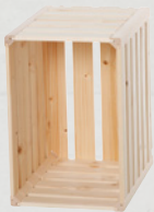
3 Wohnharasse A 1/3 35 × 23,5 × 32 cm Art.-Nr. 74712