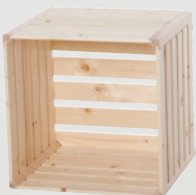
2 Wohnharasse A 1/2 35 × 35 × 32 cm Art.-Nr. 74711