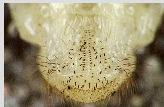
«Smiley» sur l'abdomen