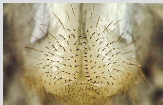
«Insigne Mercedes» sur l'abdomen