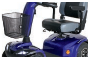
La corbeille amovible à l'avant est d'une grande capacité, pour vos achats par exemple.