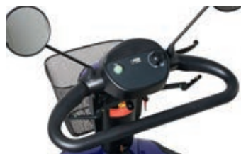
Commande facile à bascule et bouton de réglage de vitesse en continu.

angulairement et peut être parfaitement adaptée aux besoins de l'utilisateur. Le tableau de contrôle est intégré dans la colonne de direction, avec des touches surélevées. Après la pression sur une touche, un signal sonore retentit et confirme le choix effectué.