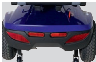
Feux et catadioptrés assurent une excellente visibilité.